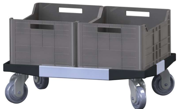
Chassis duplo para caixas normalizadas 400x300