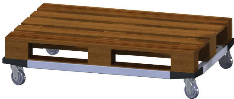
Chassis para paletes normalizadas 1200x800

Por motivos de segurança, o chassi depois de montado, já não pode ser desmontado.