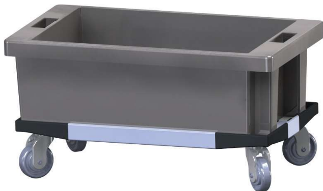
Chassis para caixas normalizadas 800x450