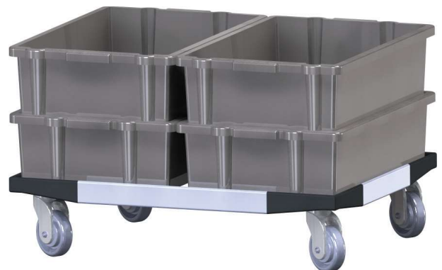
Chassis duplo para caixas normalizadas 600x400